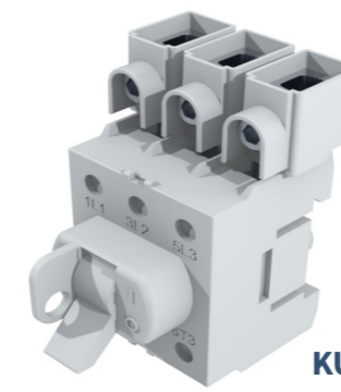
KUE 363 + 3 x KKL1X50T2

KU 3800 + 3 x KKL2X300VB (YLHÄÄLLÄ) + 3 x KKL1X300 (YLHÄÄLLÄ) + 3 x KKL2X300VB (ALHAALLA) + 3 x KKL1X300 (ALHAALLA)